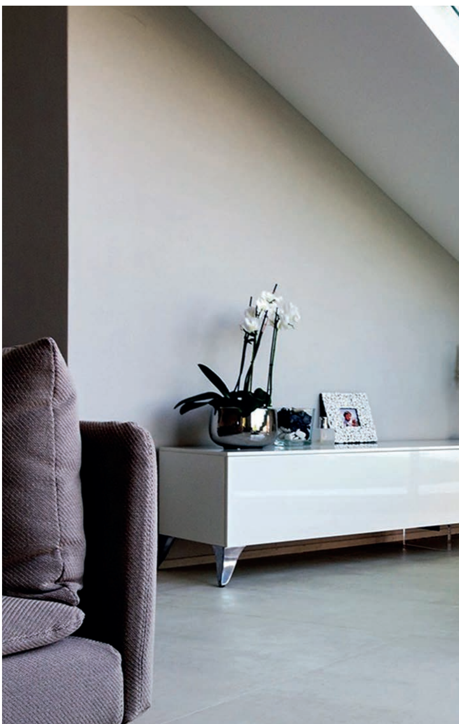
GRESTEP MARENGO CON INGLETE

antibacterial and anticovid extruded clinker