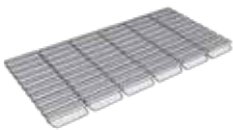
REJILLA CERÁMICA Evacuación: 19m 3 / h 500 X 245 X 25 AMB-5818 TI-5819