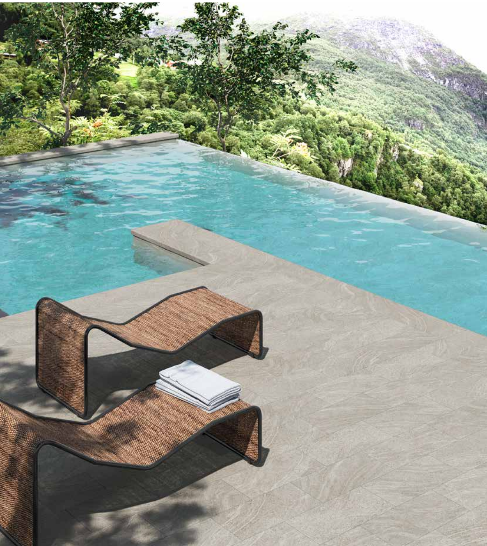
Amberes. Base 625x310 mm, peldaño recto.