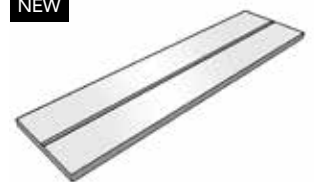
REJILLA OCULTA REGISTRABLE 500 X132X20 AMB-6690 TI-6691