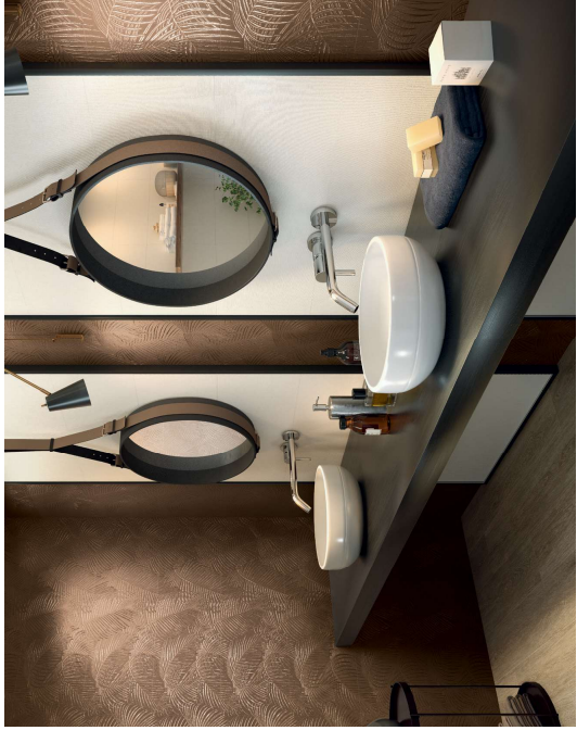
CRAYON WHITE RECT.3.16X90 / KENTIA BRONZE RECT.3.16X90

Ceramics surpasses its use as construction material and becomes a decorative element thanks to the Crayon collection. This design is very trendy, thanks to its color palette and decorative set that reproduces a jungle space.