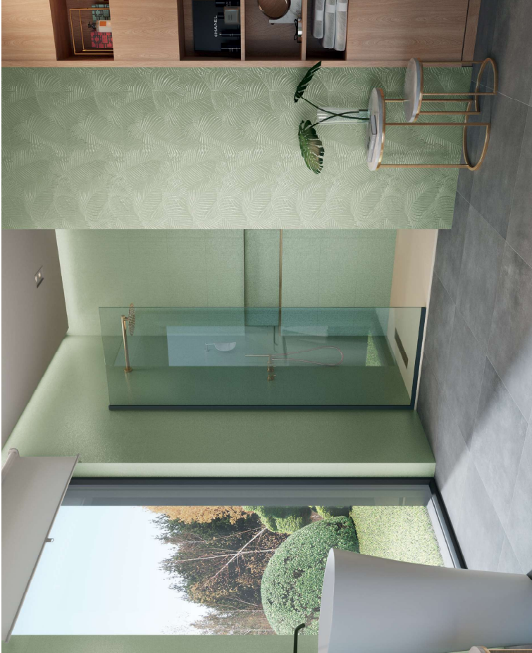
CRAYON GREEN RECT.3.16X90 / KENTIA GREEN RECT.3.16X90