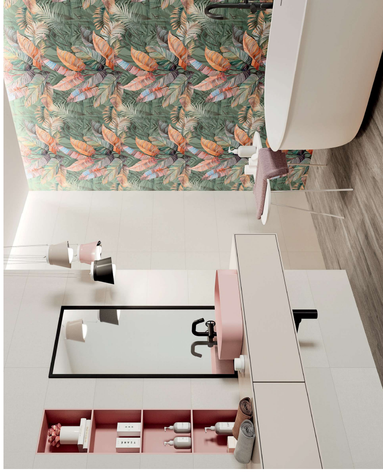
CRAYON WHITE RECT. 31.6X90 / DECOR SET (2) VERDE L. 31.6X90

T. +34 964 340 434 apegrupo@apegrupo.com apegrupo.com